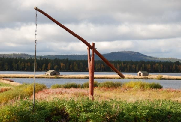
Kuva 4. Maisemaa Suvannon kylästä Pelkosniemeltä.

Osa-aluemerkinnällä maV pääasiallisen maankäyttöluokan päälle osoitetaan valtioneuvoston päätöksen (Vnp. 5.1.1995) mukaiset valtakunnallisesti arvokkaat maisema-alueet. Valtakunnallisesti merkittävä kulttuuriympäristöt (RKY 2009) osoitetaan maV -merkinnällä silloin, kun niitä ei ole osoitettu SR-/SR-1 kohteina.