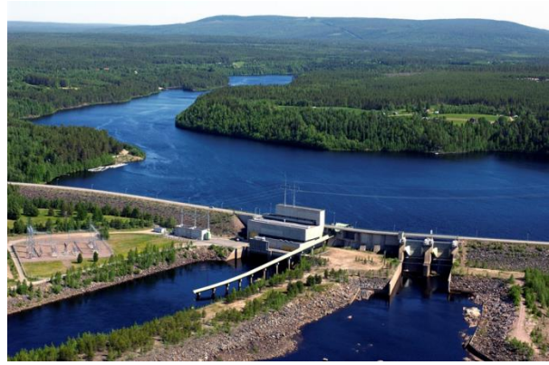
Kuva 3. Vanttauskosken voimalaitos Rovaniemellä.

Kaavamerkinnällä EN osoitetaan energiahuoltoa palvelevia laitoksia tai rakenteita, kuten voimaloita ja suurmuuntamoita. Merkinnällä on osoitettu toiminnassa olevat yksitoista vesivoimalaitosta ja suunnitteilla oleva Sierilän voimalaitos sekä kaavassa osoitettavaan altaaseen liittyvä Kemihaaran voimalaitos. Vesivoimalaitosten kohdekohtaisen suunnittelumääräyksen mukaan yksityiskohtaisemmassa suunnittelussa tulee luoda edellytykset vaeluskalojen kulkua varten. Merkinnällä osoitetaan myös Posion biovoimalaitos sekä suunnitteilla oleva Mustikkamaan biovoimalaitos.