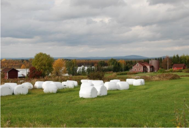
Kuva 2. Kostamon kylä Kemijärvellä on yksi maakuntakaavassa osoitetuista keskuskyläistä.

maaseudun peruspalveluiden kannalta tärkeitä kyliä, joihin suuntautuu ja halutaan ohjata rakentamista ja palveluja. Keskuskyläien valintoihin vaikuttavat väestö, olemassa olevat palvelut ja työpaikat, keskeinen sijainti ja hyvät liikenneyhteydet. Muut maaseutualueet täydentävät ja tukevat tätä keskuskyläien muodostamaa maaseudun kyläverkostoa ja kehittämisen kokonaisuutta. Kyliä kehittämistä tuetaan mm. pienyritystoiminnalla, matkailulla ja loma-asutuksella.