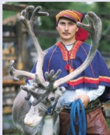
Kuva: Pirjo Puurunen