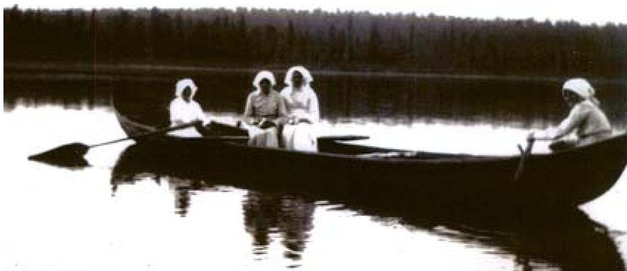
Unarin tyttöjä soutelemassa sunnuntaina, Samuli Paulaharju 1920

Unarin Nuorisoseuran talolla perjantaina 11.7.2014 klo 10-15