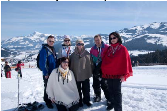
Lapin toiminnanjohtajat Itävallan kv-seminaarissa.