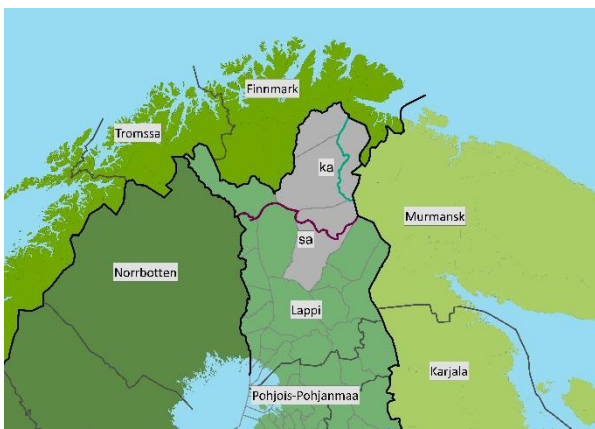
Kuva 1. Pohjois-Lapin maakuntakaava-alue ja vaikutusalueet.

Lapissa maakuntakaavoitus etenee osa-alueittain. Pohjois-Lapin maakuntakaava-alueeseen kuuluvat Inari, Sodankylä ja Utsjoki. Vaikutusaluetta on Pohjois-Lapin lisäksi koko Lapin maakunta sekä Norjan ja Venäjän lähialueet (Kuva 1). Pohjois-Lapin maakuntakaava-alueesta saamelaiden kotiseutualueeseen (Laki saamelaiskäräjistä 17.7.1995/974) kuuluvat Inarin ja Utsjoen kuntien alueet sekä Sodankylän kunnassa sijaitseva Lapin paliskunnan alue. Kolttala-alue sijoittuu Inarin kunnan itäosaan.