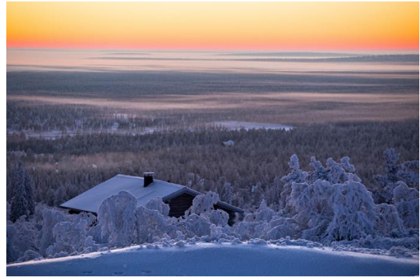
Kuva 3.